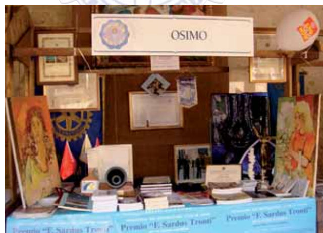
Il nostro stand

le cose più disparate: dai cappelli ai centrini in pizzo, dai sacchetti ricamati ai piattini di ceramica, dai fiori di carta alle shopper di tutti i colori con gli slogan dei progetti fatti, e poi saponette all'olio di oliva, confezioni monodose di miele, prodotti tipici del territorio, depliant e manifesti per illustrare i progetti realizzati.