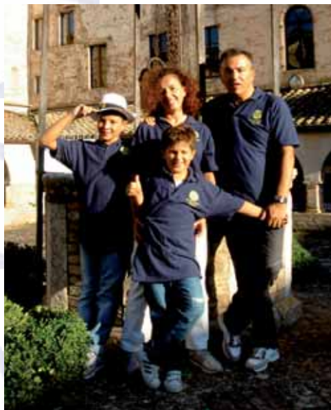
Ritratto di famiglia

A fine giornata, all'atto di "smontare" la nostra bancarella e tornare a casa, la sensazione di aver vissuto un'esperienza un po' diversa dal solito, senza forme e formalità, e devo dire che mi è piaciuto abbastanza questo Rotary in tenuta sportiva , scarpe comode e maglietta polo, spontaneo e solare, leggero e allegro come un ragazzino alla sua prima uscita: chissà, forse può essere anche questo un modo per farci conoscere e amare....soprattutto dai più giovani.