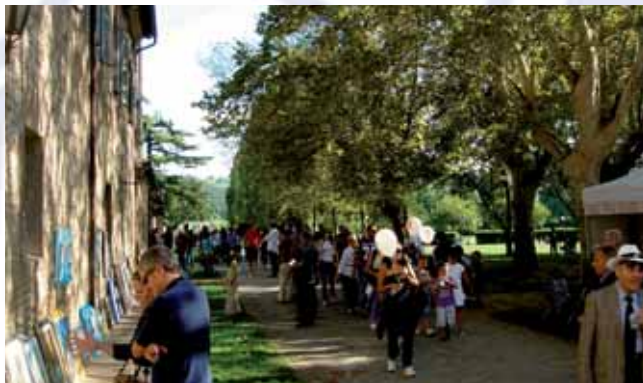
Atmosfera di serenità lungo i viali